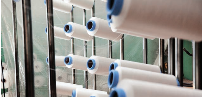
El sector del tèxtil segueix sent molt important a Mataró